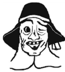
Narrenzunft Stoischweizer e.V. Betzenweiler