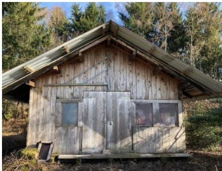
Bienenstand im Betzenweiler Ried zum kostenlosen Abbau. Besichtigung jederzeit. Tel. 07374-352